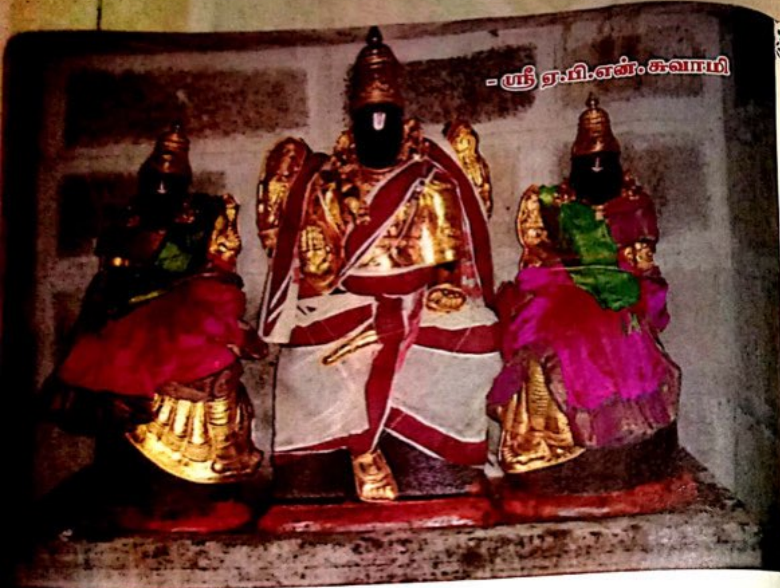
- ஸ்ரீ ஏ.பி.என். சுவாமி