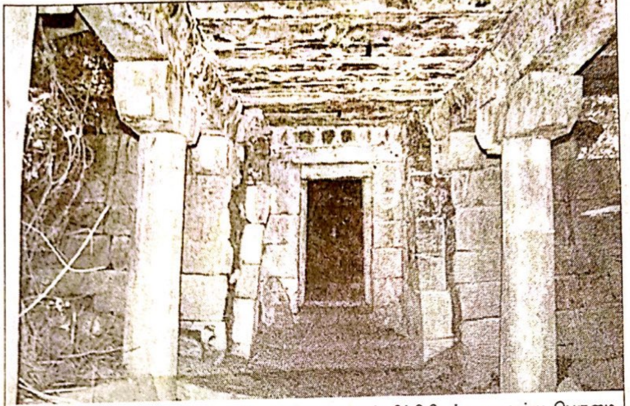
செங்கல்பட்டை அடுத்த பழைய சீவரத்தில் புதருக்குள் சிக்கியிருந்த வரலாற்று பெருமை கொண்ட இக்கோயில், இப்போது புனரமைக்கப்பட்டு வருகிறது.

லட்சுமி நரசிம்மர் கோயில் கல்வெட்டுக்களில் இறைவன் சிங்கபிரான் என்றும், கோயில்