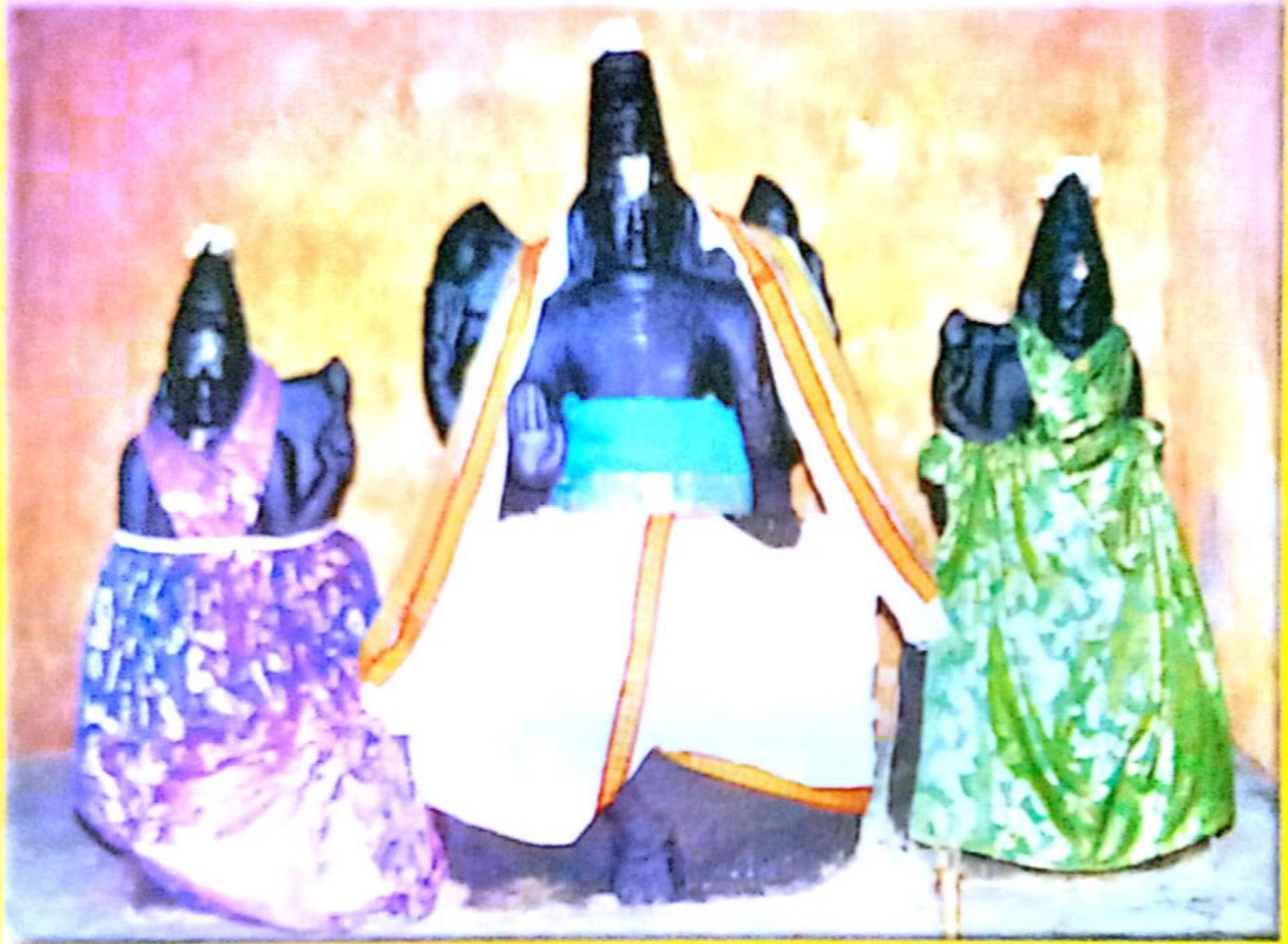
ஸ்ரீதேவி பூதேவி ஸஹித ஸ்ரீ வைகுண்டநாத பெருமாள்

ஸ்ரீ வைகுண்ட நாத பெருமாள் ஆலய ஜீனோத்தாரண, பிற சீலா சூர்த்திகள், உற்சவ சூர்த்திகள் நூதன ஸன்னிதிகள், நூதன துவஜஸ்தம்ப, ராஜகோபுர அஷ்டபந்தன மஹாபிரதஷ்டை மஹா ஸம்ப்ரோக்ஷண ஆஹ்வானம் பத்திரிகை 28-06-2007