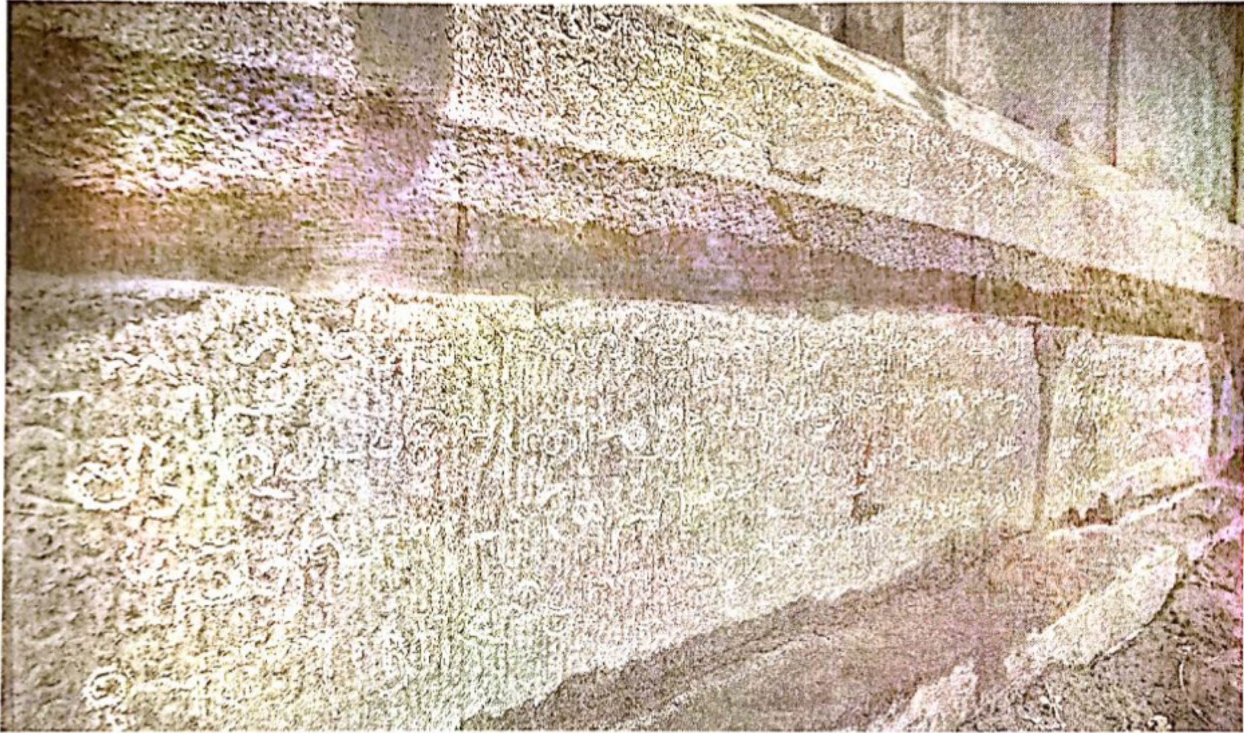
These inscriptions in Tamil of Parantaka Chola I and Parthivendrathipathi Varman found at Pazhaiya Seevaram village in Tamil Nadu provide information on how the local assembly members had to submit a list of their assets every year.

The local assembly, or variya perumakkal , met in the centre of the village, called sirkooti ambalam , and functioned for a two-year term.